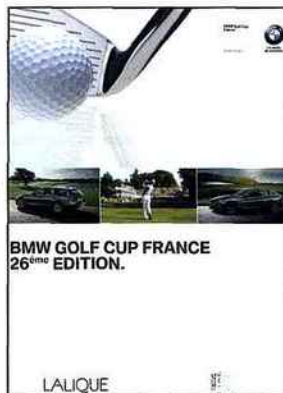
BMW GOLF CUP FRANCE 26 ème EDITION.

des étapes ouvertes à tous. Les premières épreuves se joueront le 5 mai avec les golfs d'Amiens, la Roseraie, Royan et la Porcelaine puis le 12 mai avec Toulouse, Troyes-La Cordelière, les Bouleaux et la Cabre d'Or. La finale nationale aura lieu du 4 au 6 octobre sur le golf Barrière de La Baule et la France jusqu'au mois de septembre avec notamment