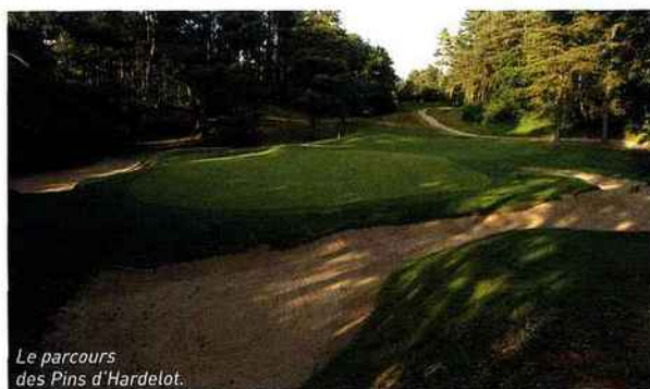
Le parcours des Pins d'Hardelot.